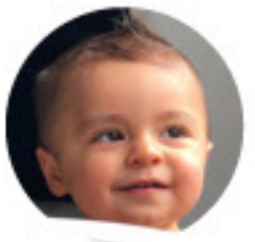
Tratamiento de Jerónimo